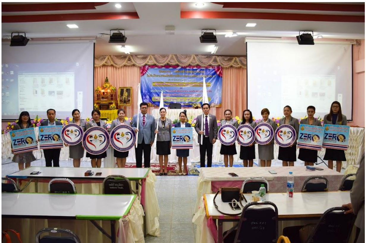
ผอ.สพป.ยโสธร เขต ๑ มอบธงเขตสุจริต และป้ายต่อต้านคอร์รัปชัน