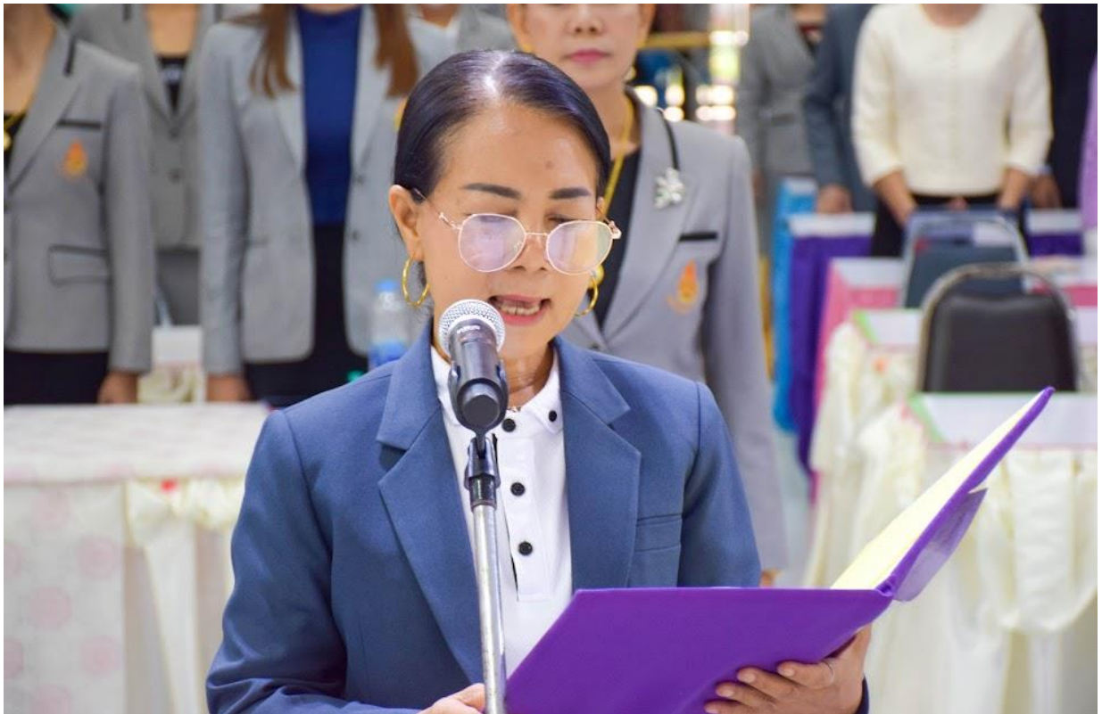
ประกาศนโยบายไม่รับของขวัญและของกำนัลทุกชนิดจากการปฏิบัติหน้าที่ (No Gift Policy) ปงม. พ.ศ. ๒๕๖๖