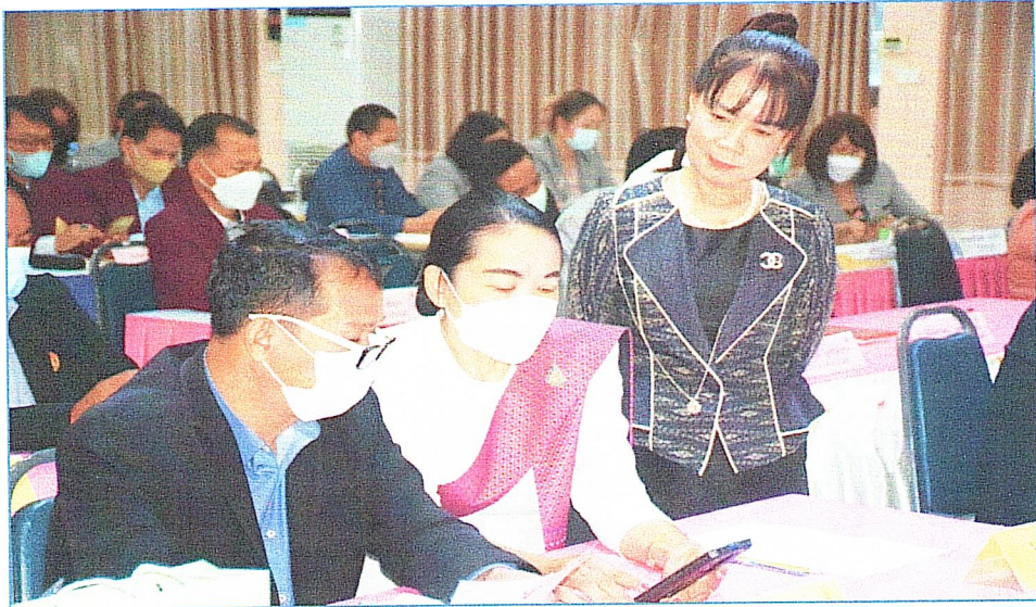
ผู้บริหารสถานศึกษา ที่เข้าร่วมการอบรม