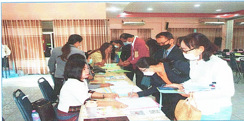
เจ้าหน้าที่รับลงทะเบียนผู้เข้ารับการอบรม